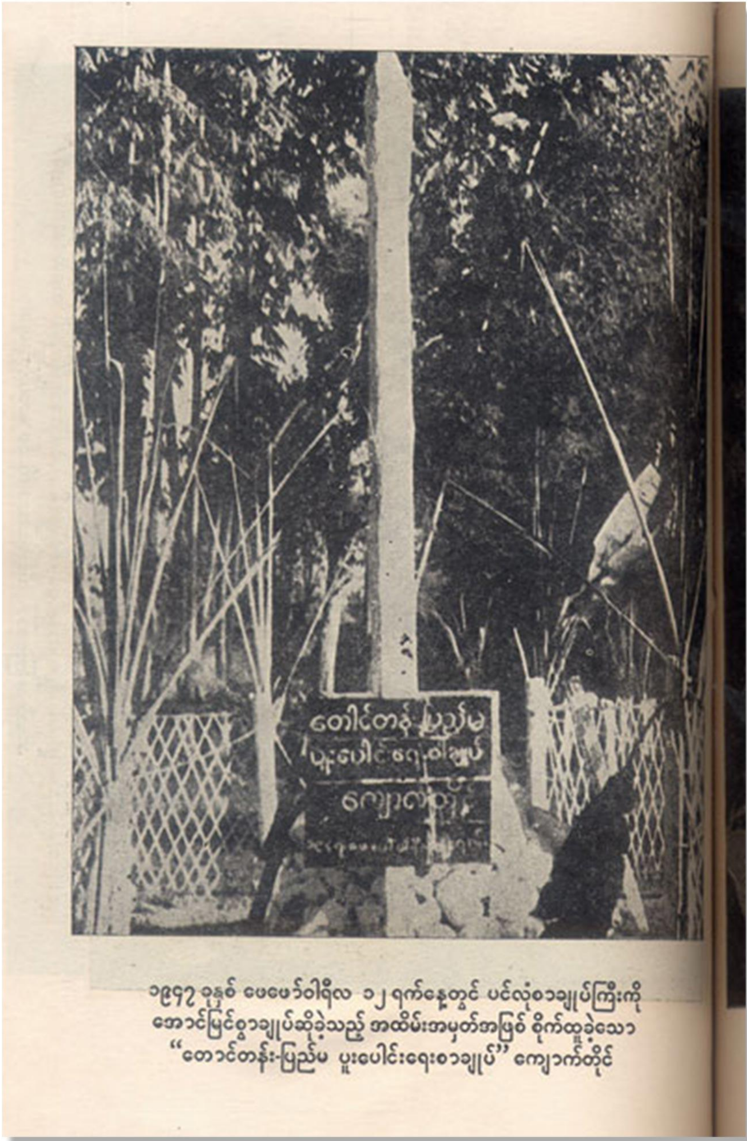
၁၉၄၇ ခုနှစ် ဖေဖော်ဝါရီလ ၁၂ ရက်နေ့တွင် ပင်လုံစာချုပ်ကြီးကို အောင်မြင်စွာချုပ်ဆိုခဲ့သည့် အထိမ်းအမှတ်အဖြစ် စိုက်ထူခဲ့သော “တောင်တန်း-ပြည်မ ပူးပေါင်းရေးစာချုပ်” ကျောက်တိုင်